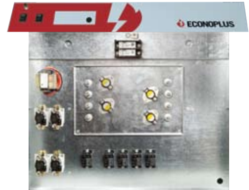
COMPARTIMENT DE CONTRÔLE

Pas de cheminée. Pas d'émissions néfastes pour l'environnement. 100% de la chaleur demeure à l'intérieur de la résidence. Propre et sans odeur, ECONOPLUS vous offre ce que le chauffage électrique a de meilleur à offrir.