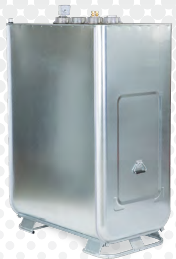
RÉSERVOIR 2 EN 1