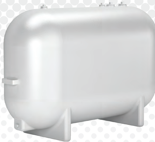
RÉSERVOIR EN FIBRE DE VERRE